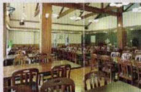
ダイニングルーム 民族感のある暖かい雰囲気の中で食事を楽しめます。