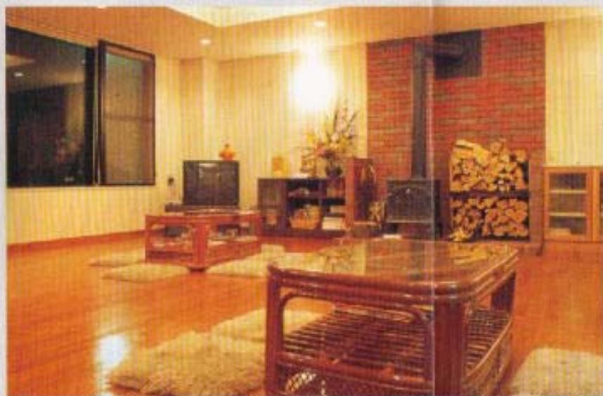
ラウンジ いごでも利用されるくつろぎの室。