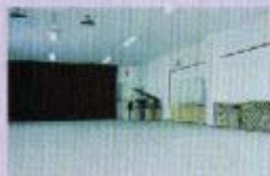
コンベンションホール 宴会・ダンスの他、会議としてもご利用いただけます。