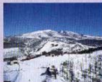
大阿山山頂より日本アルプスを望む。