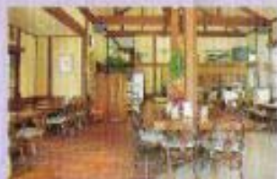
パーティールーム バーも楽しめる