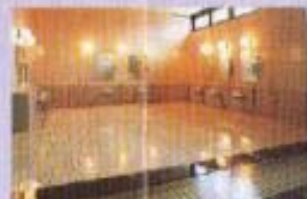
大浴場 温泉施設も併設