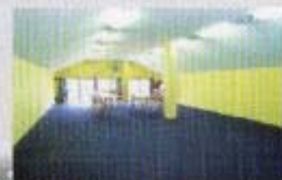
会議室 会議や研修に利用いただけます。