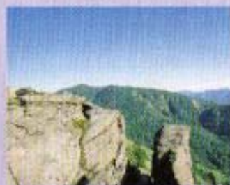
標了山より吾妻山脈阿山を望む。